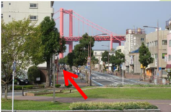
連絡通路を出たところの景色 橋に向かって左側を進む