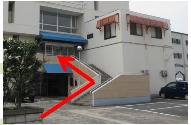
外階段を2階へあがる