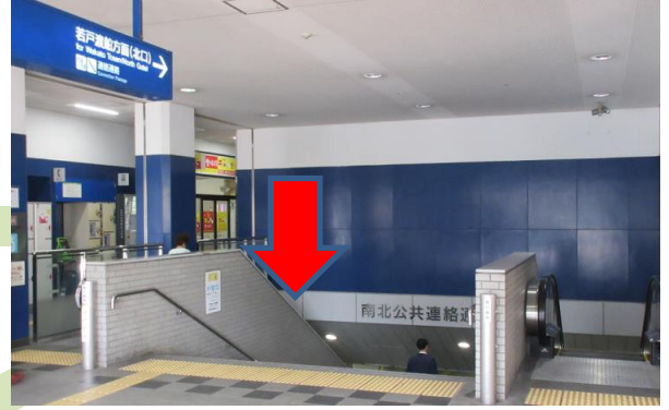
改札を出て右側にある連絡通路に進む