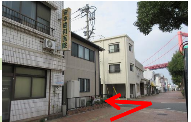
約250m進み、安本歯科の次の路地を左へ