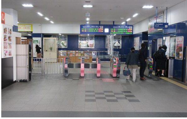
戸畑駅改札口 一カ所のみ