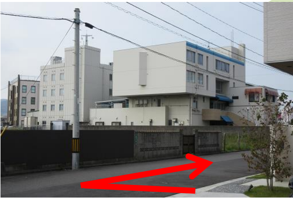
すぐ右側に見える建物がニッスイマリン会館